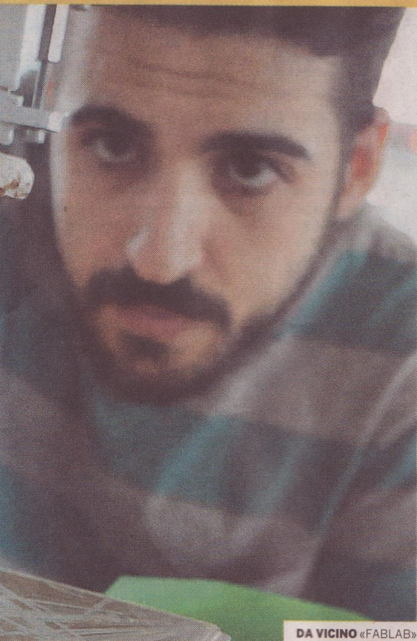
DA VICINO «FABLAB»

SHOPPING Irene Lasalvia ilasalvia@corriere.it IN FORMA/LOCALI Barbara Visentin bvisentin@corriere.it MANGIAR BENE Elena Papa elena.papa@rcs.it